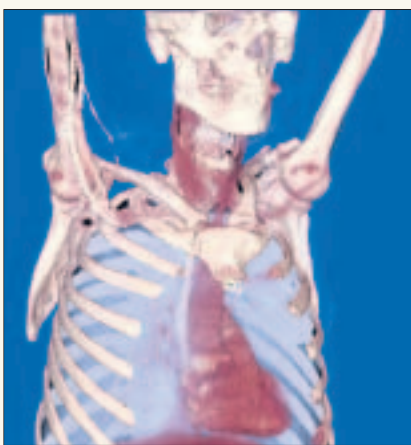
Computertomografie macht 3D-Bilder möglich. Knochen und Blutgefäße werden sichtbar.

Es ist ein Röntgenbild der neuen Art. Die Strahlenquelle rotiert um den Körper in der Röhre. Sensoren, ähnlich denen einer Digitalkamera, nehmen die Röntgenbilder auf. Millimeter für Millimeter, Stück um Stück kommt so ein Bild zum anderen, während der