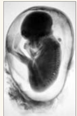
Dies ist eine der ersten Röntgenaufnahmen, die in Dresden um 1920 gemacht wurden. Über die schädigenden Strahlen war den Medizinern damals noch nichts bekannt.